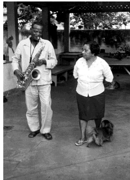
Fonte: Walter Firmo. Pixinguinha e sua mulher, Betty, no quintal de casa. https://ims.com.br/?s=pixinguinha

Considerando que as imagens expressam a relação da cultura afro-brasileira em diferentes tempos, espaços e contextos, é possível afirmar que: