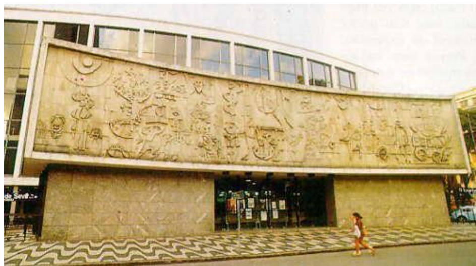
Painel Teatro Guaíra – Curitiba. Disponível em: https://www.patrimoniocultural.pr.gov.br/Bem-Tombado/Obras-de-Poty-Lazzarotto-Paineis-e-Murais-em-Curitiba

Disponível em: https://www.teatroguaira.pr.gov.br/Pagina/Sobre-o-Teatro-Guaira