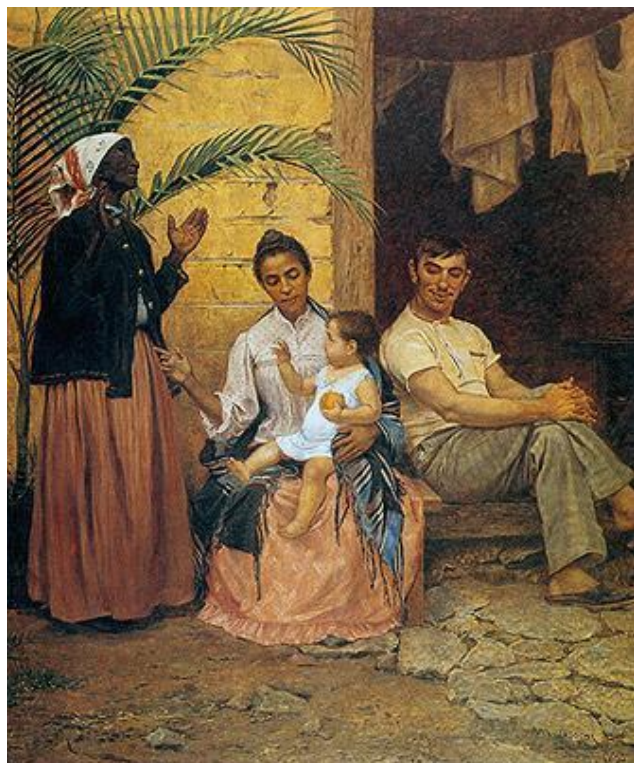
BROCOS, Modesto. A Redenção de Cam . 1895.

Observe a imagem e leia o texto, a seguir: