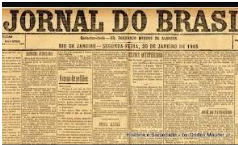
Jornal de 1905

Observe as imagens e classifique-as de acordo com o tipo de fonte histórica: