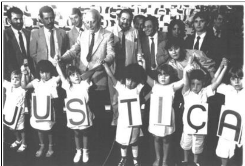
Crianças no Congresso Nacional.