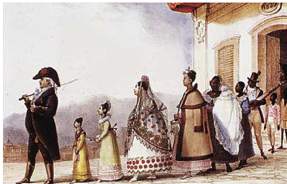
Representação de uma família colonial, por Jean-Baptiste Debret (1768-1848).

Disponível em: < https://commons.wikimedia.org/wiki/File:Fam%C3%ADlia_colonial.jpg > Acesso em: 17/06/2020.